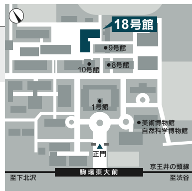
京王井の頭線「駒場東大前」駅下車